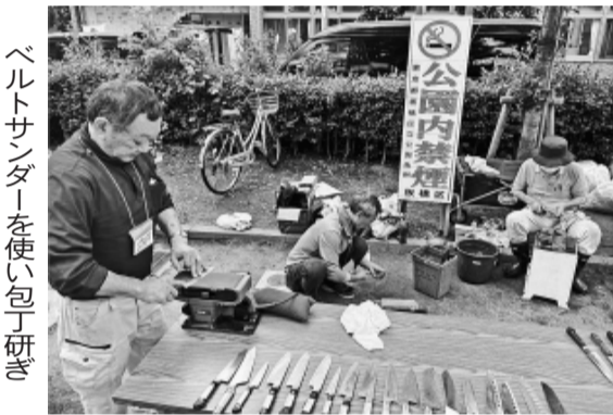
ベルトサンダーを使い包丁研ぎ