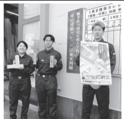
授業・学校見学お気軽に