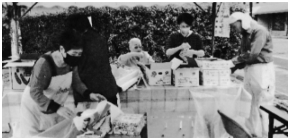
野菜販売しました