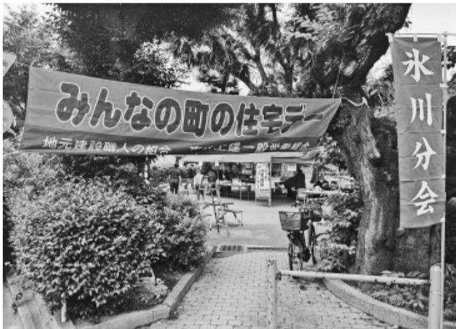
6月7日に15会場で住宅デーを開催

6月7日、緑ヶ丘第一の町の住宅デーを開催し、公園で毎年恒例のみんなの町の住宅デーを開催しました。住宅デーのメインイベントの包丁研ぎは60本。住宅相談は3件。コッパトイ、カナ削りを行いました。