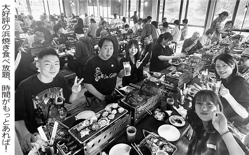
大好評の浜焼き食べ放題、時間ももっとあれば!

め、「重篤化の防止」が何より大切と強調しています。意識が明瞭な場合でしたら、作業を離脱させます。意識が不明瞭な場合は、涼しい場所で脱衣・冷却し、水分・塩分を摂取させます。意識が異常があれば救急車を呼びます。到着するまでの間は決して一人にせず、体に水をかけ風を当てるなどして冷やしましょう。搬送の判断に迷ったら、7119に相談を。予防には暑熱順化が大切です。本格的に暑くなる前に、運動や入浴などで汗をかき、暑さに強い体になることが必要です。