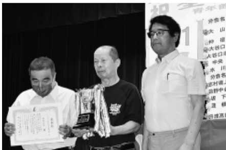
仲宿分会は実増で表彰