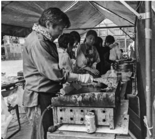
今日はヤキソバやさんに転職？

前日より、男性軍はテの用意点検、女性軍は、ント・机その他必要備品 焼きそばその他の買い