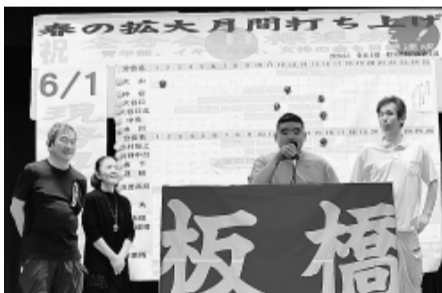
志村坂上分会から拡大経験報告