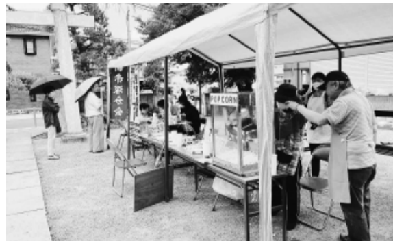
ポップコーンの機械が大活躍

雨が心配でしたが手配して行きたいので何とか開催できました。新赤塚分会はポップコーンの機械が有るのでとても見栄えはしますし、お客さんに無料で渡せたので好評でした。次回にはもう少し多くの方々が来場するように宣伝していきます。