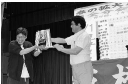
連続受賞の徳丸分会