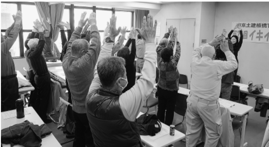
イキイキ会総会での健康教室は全員で体を動かしながら楽しく学ぶ