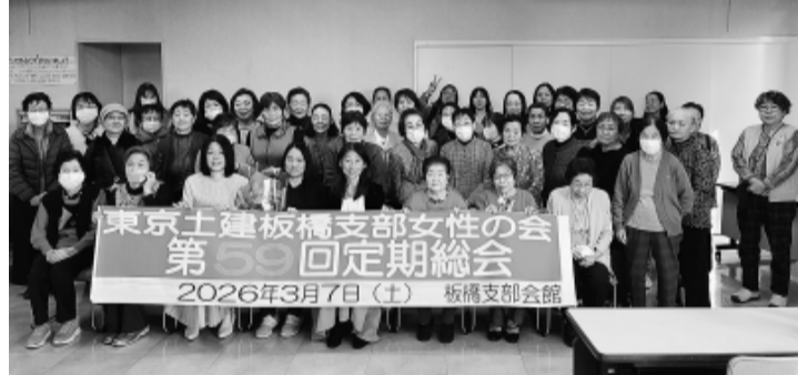
女性の会総会に集まった参加者

組合の共済制度に、小・中学校の新入学祝があり、この4月に入学する子どもが対象です。申請書と添付書類を群会議で提出して下さい。申請書は、各分会の分會センターや板橋支部事務所にあります。