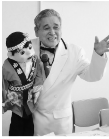
おなじみゴローちゃん登場