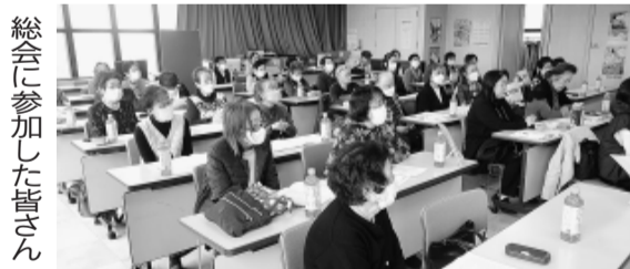
総会に参加した皆さん

3月15日支部会館で女性の会総会を開催し、47人が参加しました。午前中の学習会では「マイナ保険証を作らないとだめ？資格確認と資格情報のおしらせの違い」について、本部