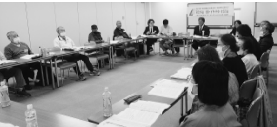
群会議の充実に向けて意見を交わす第5分科会

マイナ保険証が話題になり、「有効期限が切れ、更新しないと保険証として使えなくなった」「更新の時にマイナ保険証にされてしまった」「きちんと説明を求めて、みんなに判断してもらおう」との発言がありました。