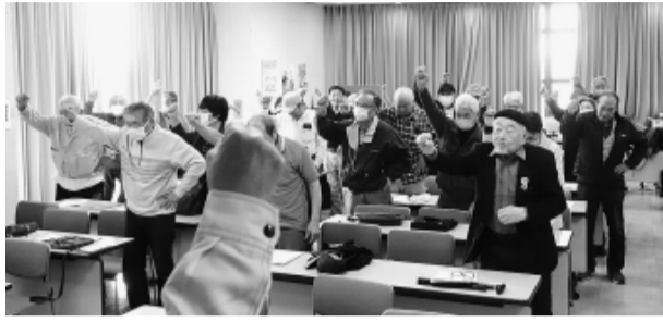
イキイキ会も団結ガンバロー

笑いながら学びました。道端で声をかけられ、儲け話を持ち掛けてくる詐欺、「この人詐欺です」と騒ぐ手口、警察からの電話で、カードが不正に使われたなど巧みな事件について披露しました。還付金詐欺については、