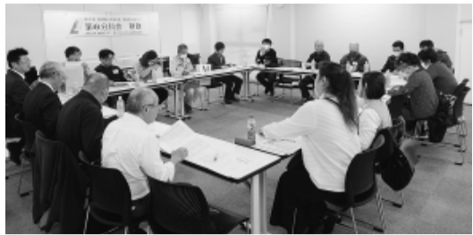
組合費納入や分会財政を交流する第6分科会