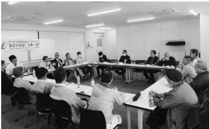
住宅デーや学習会の強化を話し合う第2分科会