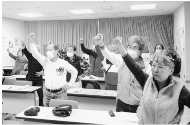
団結ガンパローで意思統一

3月25日、東京都連賃金統一行動が行われ、都内31か所の駅頭で、一回は、初めて支部ごとサテライト会場を設けて学習集会を開催した。板橋支部では支部会館5階に19人が参加し、