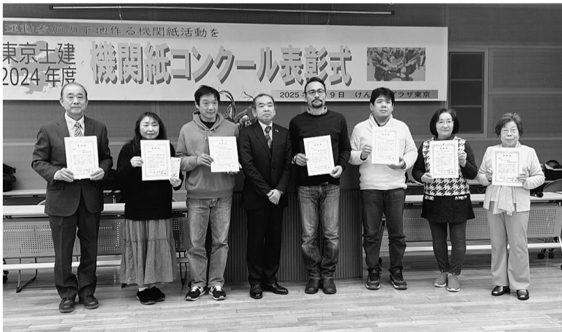
表彰を受けたみなさん

表彰を受けたみなさん、おめでとうございます。組合があるべき本質を今こそ見直し、原点に返って必要性を学び訴えることが、仲間との参加意欲につながるのではないかと思います。