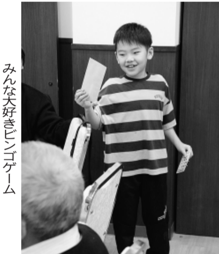
みんな大好きビンゴゲーム

ちょうど、他のお客さんの混雑時間と重なり、料理の出だしが遅れましたが、出始めれば食べきれない量の料理がテーブル一杯に広げられ、お酒もビール・焼酎・紹興酒と飲みきれない量でした。