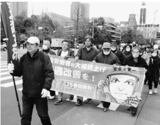
国会に向けてデモ行進する板橋支部の仲間