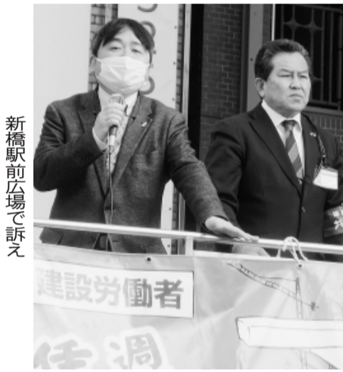
新橋駅前広場で訴え

員約200人に対して、 地域建設産業の担い手確 保・インボイス制度中止 公契約法の制定などを要 請。同時に新橋駅前、 宣伝行動を行い、世論に 建設産業の実態を伝え、 私たちの運動への理解と 協力を訴えました。「自 分も建設労働者だ。賃金 が安すぎる。頑張って」 などの声もよせられまし た。 集会終了後は、国会議 堂を 引き上げなど処遇改善の ために、請求・要求運動 を大きく前進させること を意思統一しました。