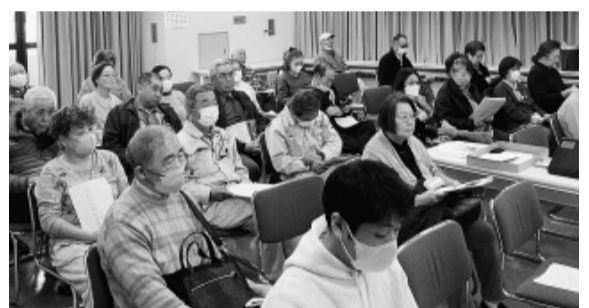
学習会に参加したみなさん

使っています。その紙は雑草を防ぎますが紙も農機も高額なものです。また紙は重さが40kgもあるため、高齢者にとっては重労働となっています。おきたまでは有機肥料を自前で作っています。2年前に中国から化学肥料が急に輸入されなくなり、国内肥料の値段が倍増し、入手できなくなった時でも、生産価格を値上げせず、消費者に安定供給することができました。