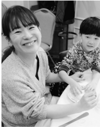
上手にできたかな