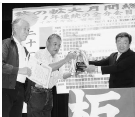
実増率1位 舟渡高島分会