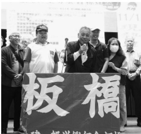
訪問数1位徳丸分会