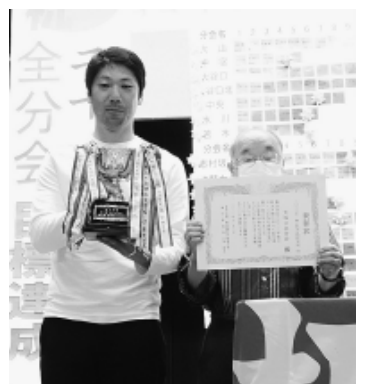
拡大率1位 大谷口北分会

とんかち談 猛暑が嘘のように、朝晩は急に冷え込んで、体調をくずされ方も少なくないのではないかと。インフルエンザも猛威を振る、薬不足が話題になっている。猛暑の影響は、生活の場面にも直撃している。せつかく鍋の季節到来とおもいきや、なんでネギがこんなに高いのと伸びた手を引っ込める。▼事情が分かってい る人間はまだまだだが、野生の動物はたまったものではない。もともと住んでいた領域を勝手に荒らされ、追い込まれた山奥でエサが不足し、危険を承知で人里に降りてくれば、害獣扱い。なんだから理不尽。温暖化で、南極の水が溶けたし、コウテイペンギンのヒナが成長できず、繁殖失敗が相次いでいるとか。こうした温暖化を加速させる戦争がまた起きている。人間は、他の動物たちを次々と絶滅に追いやっているが、生身の人間だって例外ではない。▼ここまで壊れておいて、どこまでできるかわからないが、気候危機を打開しようという運動も始まっている。わたしも、できる所から主体的に環境のことを考えなきゃとしみじみ考えさせられている。