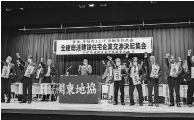
交渉成功に向け団結ガンバロー

築、国民のプロファ イルングが狙われて いる など詳しい説明がありました。 こうした政府の動きに対して、「違憲差し止め訴訟」や、