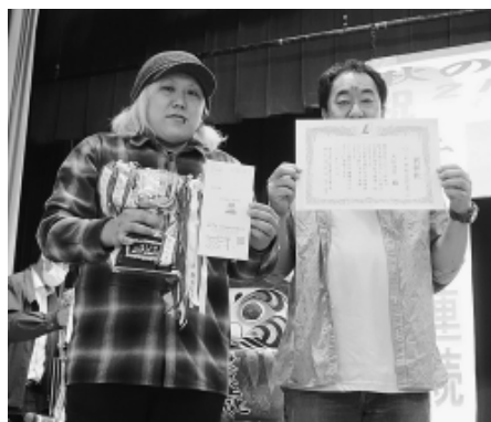
拡大数1位 大山分会

持続可能な建設業を実現しよう 全国の仲間と国会請願署名を成功させよう 板橋支部では12月から署名に取り組みます。建設労働者の減少と高齢化が深刻な事態となつて います。こうした現状を打開し、後継者の育つ建設産業めざし、全国の仲間と国会請願署名に取り組みます。 建設産業は、安心・安全な暮らしを支え、災害復旧にもなくてはならない産業です。それが持続の危機をむかえ大ピンチです。皆様のご協力を願います。