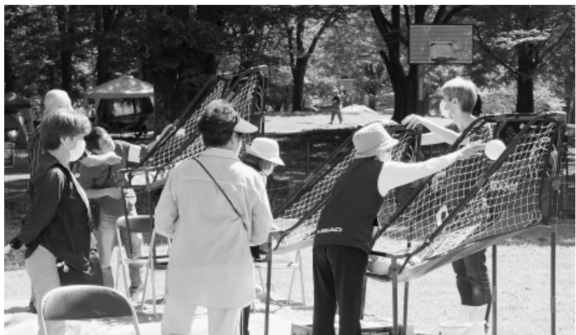
午前の部の参加者も楽しんだようです

午後1時30分から開始した午後の部では、小さな子どもさんもパパやママと家族で一緒に楽しむ光景が見られました。子どもたちに人気だったのは、バランスティスクギャッチとストラック