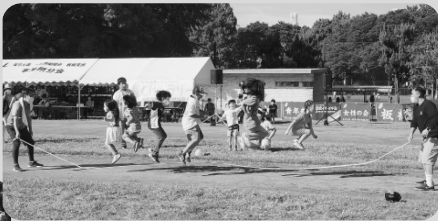
大なわとびも大人気