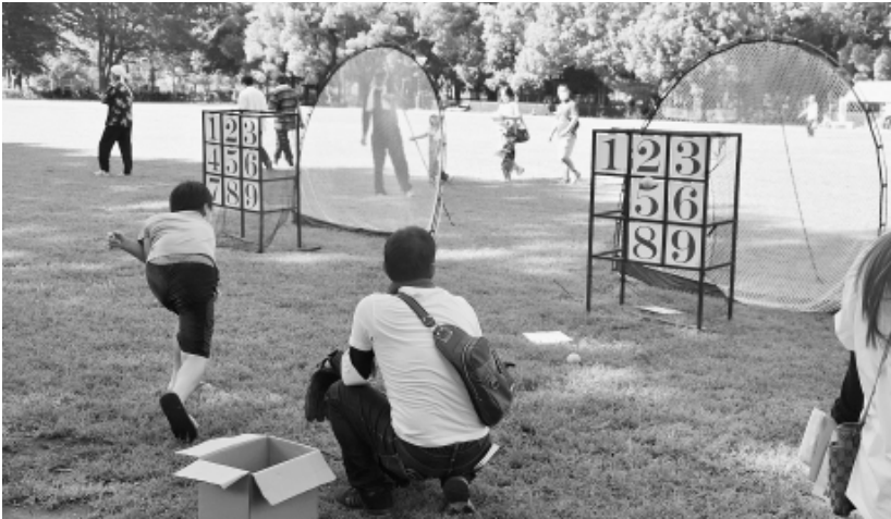
人気ナンバーワンのストラックアウト

9月25日(日)、赤塚公園陸上競技場でスポーツイベント・どけんラリー&拡大中間決起集会を開催しました。コロナ禍のなか、運動会に替わるものとして今年で3回目の開催。午前の部(全世代の組合員対象)午後の部(若手子育て世代対象)の二部制で行いました。