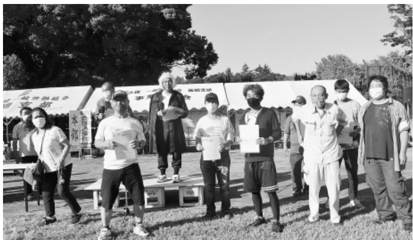
4分会から7人の加入書の持ち寄りがありました

たちもいました。参加者からは「去年も来て楽しかったので今回も参加した」「どけんラリーも楽しいが運動会がしたい」などの声が寄せられました。来賓の方は「子どもが多くて、この企画はとても良いと思う」と感想を語っていました。 お楽しみ抽選会 お楽しみの抽選会は午前・午後の2回行いました。午後の部は子どもたちのみ対象で行い、ニンテンドースイッチやラジコン、化石発掘セットなど豪華賞品が用意されました。追川実行委員長が抽選を行い、当選番号が読み上げられるごとに歓声が上がり、ワクワクドキドキの抽選会となりました。当たった子どもたちは大喜びしていました。 中間決起 7人の加入持ち寄り 月間目標達成への決意固め合う どけんラリー当日には組織部からの仮装パフォーマンスとともに穴澤組、組織部長が拡大月間成功へ「訪問行動を強め、組合のメリットを広めて、対象者を掘り起こし、全分會目標達成しよう」と訴えました。4分会(大山、若木、志村坂上、前野中台)から7人の加入書の