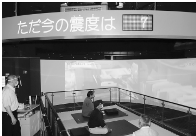
地震体験コーナーでは3人ずつ体験。震度が上部に表示されます

坂本区長のあいさつが代読されました。「核兵器廃絶を訴え、長きにわたる行進を続け、平和を訴えてこられた方々に心から敬意を表する」「平和行われます」 区長から激励あ