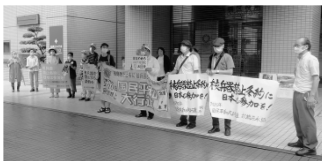
今年は板橋区役所で核兵器廃絶をアピール

などからあいさつがあり、「核兵器の保有や使用を全面禁止する核兵器禁止条約の批准は40カ国になっている。条約発効に必要な批准数は残り10カ国・地域となった」と紹介、条約発効めざ