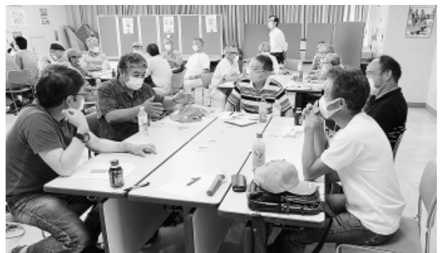
グループごとに「クロスロード」を行いました