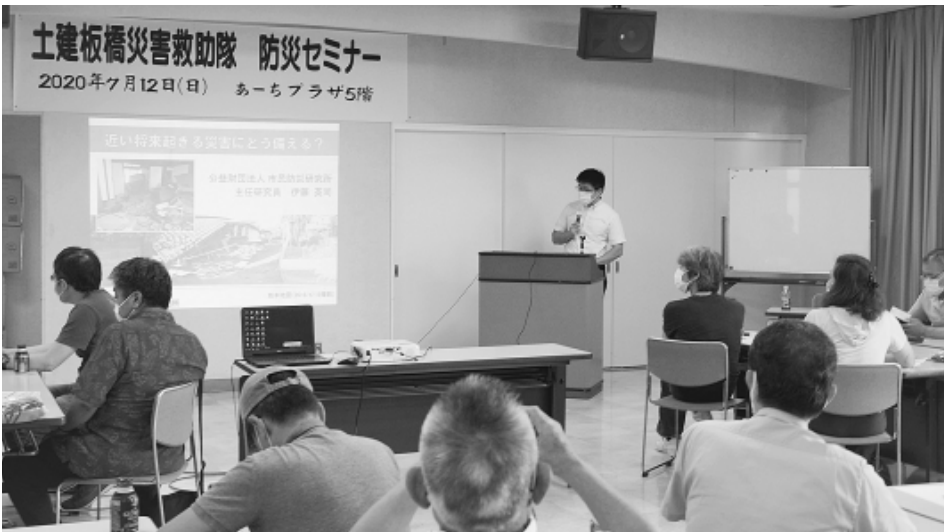
「近い将来に起きる災害にどう備えるか」をテーマに防災セミナーを開催しました

地震被害では、軽減させる3つのポイントとして、①建築物の耐震化②出火防止対策③初期消火対策で、火災を起こさない、最小限にとどめる大切さが強調されました。